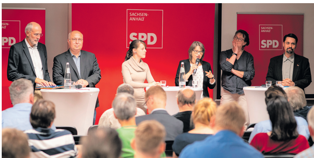
Vorstellung der Kandidatinnen und Kandidaten bei der ersten Regionalkonferenz in Magdeburg